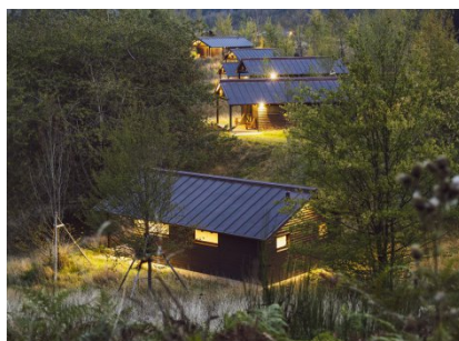
Vista esterna di alcuni lodge

Il ristorante Le Felci è una struttura in legno costruita all'interno di un'edificio esistente in pietra.